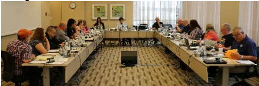
(Membres du Conseil)

Au congrès en 2014, les membres ont élu des syndicalistes dévoués pour former le Conseil de la région. Après le congrès, les directeurs et directrices ont reçu une formation sur les médias sociaux. Plusieurs sont ensuite devenus la voix du syndicat dans leur région. Ils ont aussi suivi un atelier sur les espaces sécuritaires, une formation qui vise à créer des alliés et des espaces sécuritaires pour les gens de la communauté GLBT.