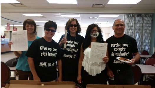
(Membres du SEIC 60269, Bathurst, N.-B.)

Grâce à l'appui de nos membres et à la détermination de nos équipes de négociation, nous avons réussi à conserver notre régime de congés de maladie. Malgré l'entrée au pouvoir d'un nouveau gouvernement, nous avons dû maintenir la pression pour protéger cet important avantage, un avantage que devraient avoir tous les travailleurs et travailleuses. Je suis très fière de toutes les activités de mobilisation que nous avons organisées pour promouvoir des milieux de travail sains.