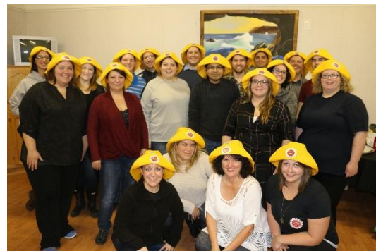
(Symposium des jeunes membres 2016)

À la suite du Congrès national de l'AFPC en 2015, l'âge limite pour être considéré comme jeune membre est passé de 30 à 35 ans. Du 4 au 6 novembre 2016, nous