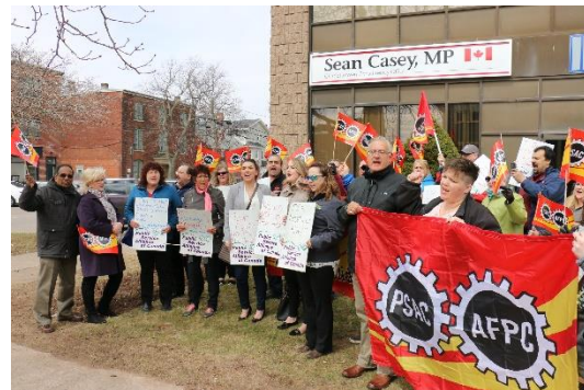
(Membres du Conseil de la région de l'Atlantique, personnes invitées et observateurs et observatrices à une manifestation impromptue à Charlottetown, î.-P.-É.)

Le Conseil se réunit en personne deux fois par an, et par téléphone au besoin. Nous profitons de chaque réunion en personne pour défendre les travailleurs et travailleuses. Nous avons exprimé notre mécontentement lorsqu'on nous a offert le Chronicle Herald à certains endroits alors même qu'une partie du personnel de ce journal était en grève. Nous avons piqueté avec des grévistes. Nous avons tenu une manifestation impromptue contre la lenteur du gouvernement à arranger le système Phénix. Et ce ne sont là que quelques exemples de nos actions politiques.