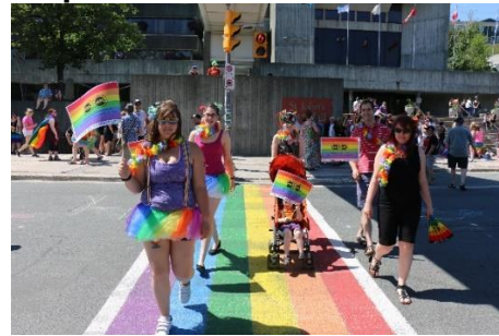
(Défilé de la fierté gaie 2016 de St. John's)

Nous continuons de participer à divers défilés de la fierté gaie dans la région en soutien à la communauté GLBT. Plusieurs comités régionaux collaborent pour assurer une forte présence de l'AFPC à ces événements.