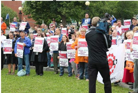
(Rassemblement à St. John's, T.-N.-L.)

Sans surprise, les problèmes causés par le système de paye Phénix ont occupé une grande place dans notre action politique. L'AFPC a soutenu les Éléments dans l'organisation de diverses activités. Nous avons par exemple épaulé l'Union des employés de la Défense nationale qui a organisé une distribution de tracts, une conférence de presse et une manifestation à St. John's, Terre-Neuve, ainsi que le Syndicat des employé-e-s du Solliciteur général qui a organisé un lunch d'appréciation pour les membres de l'AFPC aux deux sites du Centre de la paye à Miramichi et des campagnes de lobbying. Pour sa part, le Comité jeunesse de St. John's a attiré l'attention des médias en peignant sur la neige le message « Fix Phoenix ».