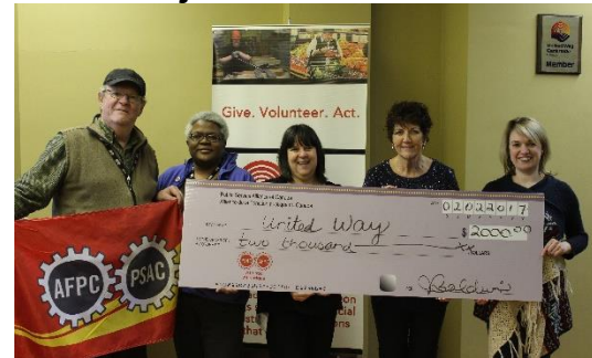
(Membres du Conseil régional du Cap-Breton et du Comité régional des femmes qui présentent un chèque à Centraide)

Le Fonds de justice sociale offre une aide précieuse à la société partout au pays, notamment en Atlantique. Nous avons beaucoup fait pour promouvoir le FJS dans la région. Nous avons fait connaître les projets anti-pauvreté qu'il commandite dans chacune des Provinces de l'Atlantique, ainsi que le travail de solidarité internationale qu'il fait avec le Centre de Tatamagouche, en Nouvelle-Écosse, dans le cadre des projets l'Éducation à l'œuvre et Breaking the Silence . Le FJS nous a permis d'aider des localités frappées par des catastrophes naturelles, par exemple des inondations en Nouvelle-Écosse et une tempête de verglas au Nouveau-Brunswick. Il importe que nos membres voient le FJS à l'œuvre chez eux.